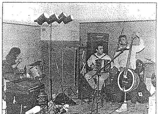
Arakajun taldeak orain dela hilabete aurkeztu zuen diskoa.

Autobusa Herri Urratsera Udalak bi autobus antolatuta ditu Herri Urratserako. Izena goizez eman behar da eta irteera igandean egingo da, 8.30ean Joseba Barandiaren enparantzatik.