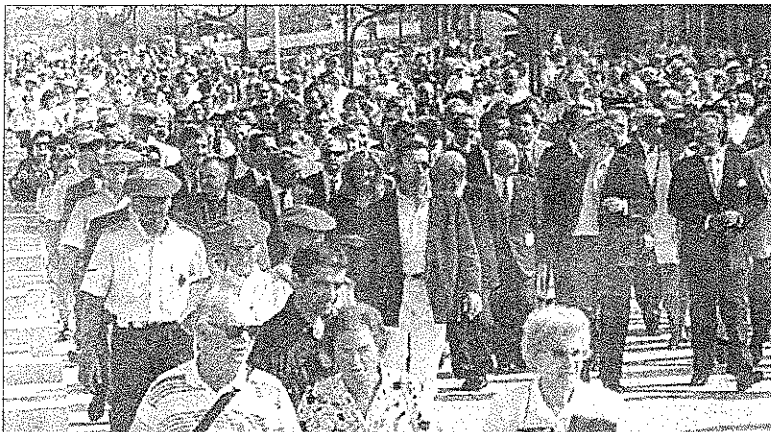
Malekoi berria inaguratzera Tocino ministroa etorri zitzaigun.

Herritar askoren iritzirako, bertan gastatutako milioiak herriko gazteen beharretan edo etxebizitza merkeagoak eskaintzen xahututa ez ziokeen kalte handirik egingo herriari.